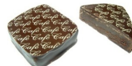
PALET CAFÉ Ganache noire 66% cacao au café.