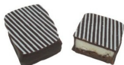
MENTHE VIVE Praliné au miel et ganache blanche à la menthe.