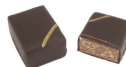
CRAQUIN Praliné biscuité croustillant au léger goût de caramel.