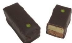
FEUILLETÉ PISTACHE Ganache à la pâte de pistache et praliné feuilleté.