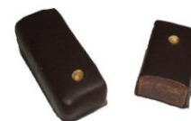
LE TONKA Ganache au praliné noisette Parfumé à la fève de Tonka.