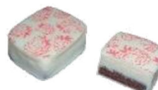
CITRON FRAMBOISE Ganache au citron sur fond de ganache framboise.