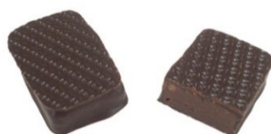
CROQUANT NOUGATINE Ganache à la noisette et amandes hachées caramélisées.