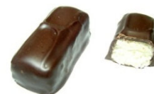
LE FRUIT DES ILES Pâte d'amande parfumée à la noix de coco râpée.