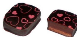
LE FRIVOLE Ganache au gingembre et praliné amande à l'ancienne au tonka.