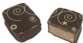
GANACHE AU NOUGAT Ganache à la crème de nougat agrémentée d'éclats de nougat blanc.